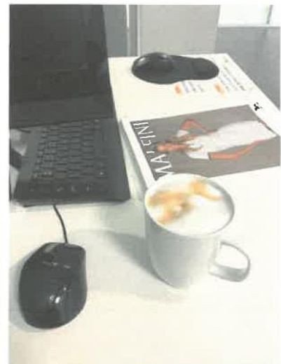
VELKÉ PLUS - MNIKAJÍCÍ KAŮVÁR