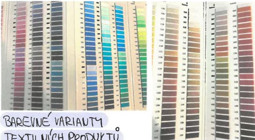
BAREVNÉ VARIANTY TEXTILNÍCH PRODUKTŮ